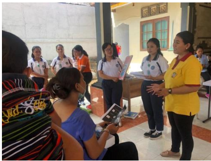
Gambar 3. Pemaparan Materi