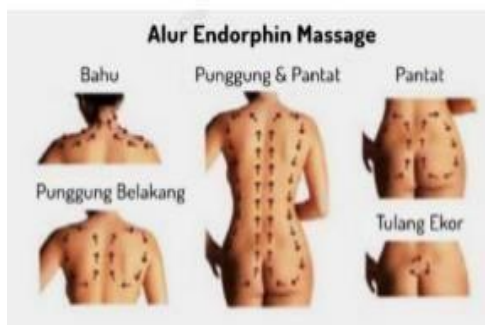
Gambar 4. Teknik Pijat Endorfin

Pada tahap ini dilakukan role play terkait dengan pijat endorfin