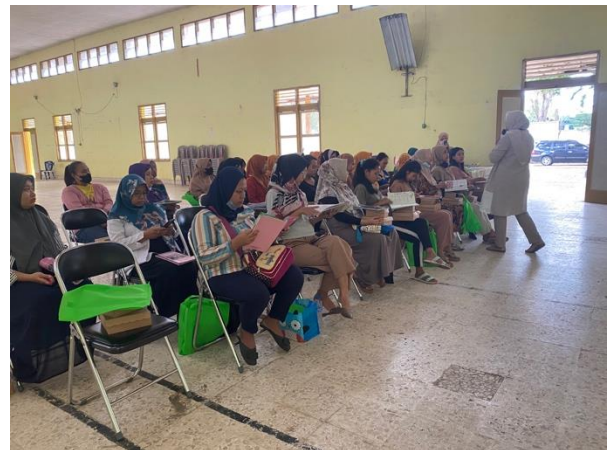
Gambar 2. Kegiatan tanya jawab dengan ibu hamil.

Berdasarkan data yang didapatkan dari hasil pretest dan posttest dapat dilihat bahwa terdapat peningkatan pengetahuan ibu hamil dan kader ibu hamil dari rata-rata setelah adanya pemaparan materi terkait deteksi dini komplikasi pada kehamilan. Hal ini sesuai dengan penelitian yang dilakukan oleh Andy Syntha Ida (2021) menunjukkan ada pengaruh antara edukasi terhadap kemampuan dalam deteksi dini komplikasi pada masa kehamilan di Wilayah Kerja Puskesmas Tamalate Makassar. Kurangnya pengetahuan ibu terkait tanda-tanda bahaya kehamilan dapat berdampak pada komplikasi di masa kehamilan dimana dapat mengakibatkan keterlambatan rujukan yang meliputi terlambat mengambil keputusan, terlambat mengakses pelayanan dan terlambat mendapatkan pelayanan yang tepat saat tiba di fasilitas kesehatan. Tanda bahaya yang diketahui lebih dini akan lebih cepat tertangani sehingga dapat meminimalisir terjadinya kondisi yang lebih parah.