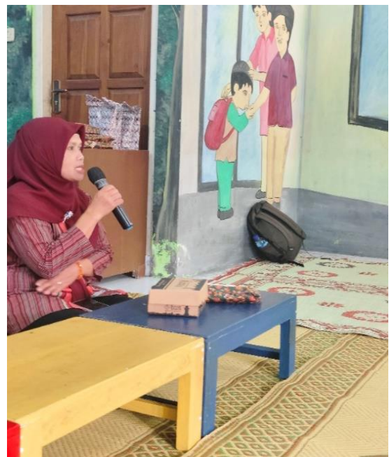
Gambar 3: Ibu Kepala Desa Memberikan Sambutan