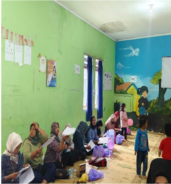
Gambar 4: Peserta Mengisi Pre Test