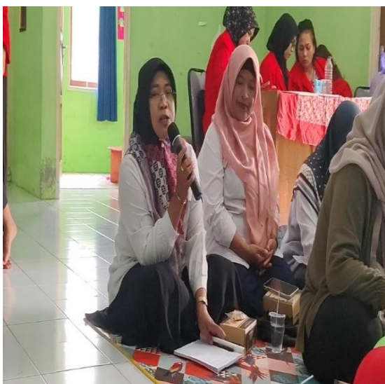
Gambar 6 : Peserta Mengajukan Pertanyaan