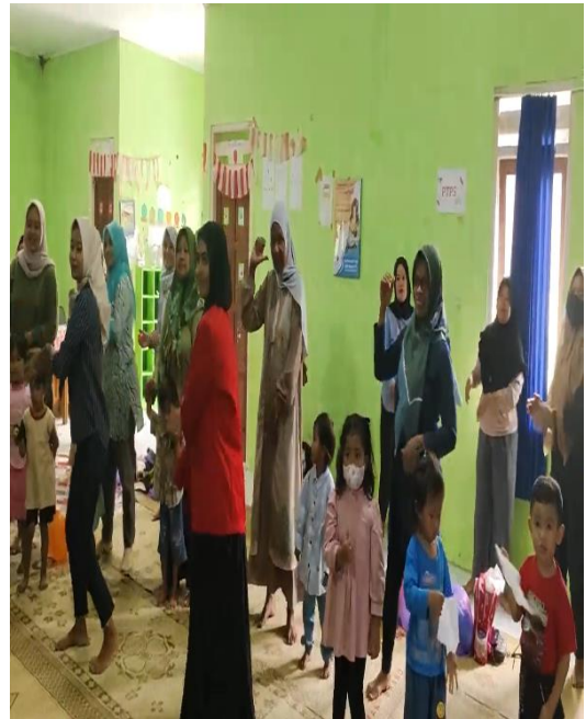
Gambar 8: Senam “Isi Piringku”