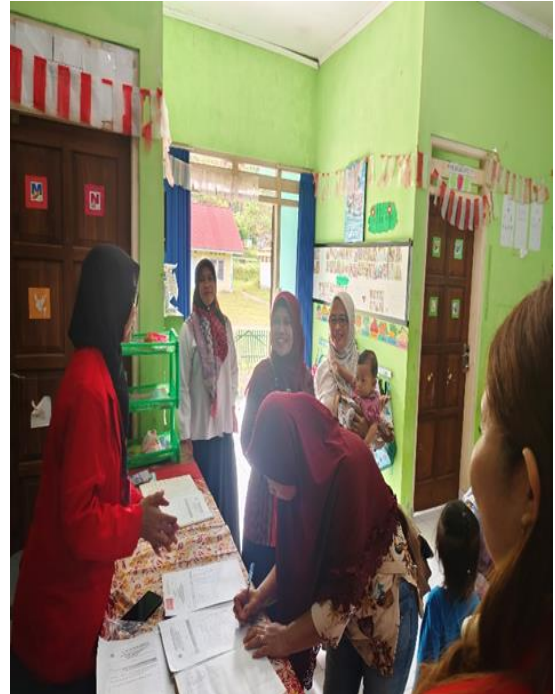
Gambar 2: Para Peserta Mengisi Daftar Hadir.

Rangkaian kegiatan terdiri atas: pembukaan, pengisian pre-test , penyampaian materi, diskusi, post-test , senam edukatif, dan penutupan. Berikut ini adalah gambar kegiatan edukasi makanan dan bekal sehat dengan konsep isi piringku di dusun Kepuh Kalurahan Kepuharjo