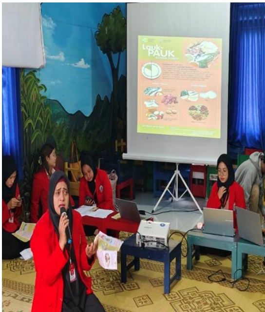
Gambar 5: Presentase Materi Penyuluhan