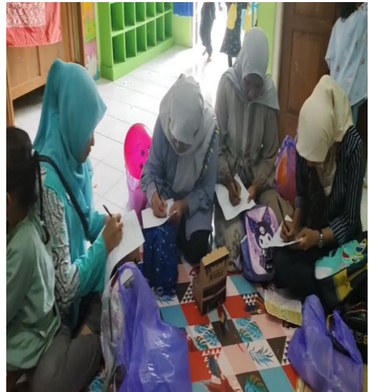
Gambar 7: Peserta Mengisi Post Test